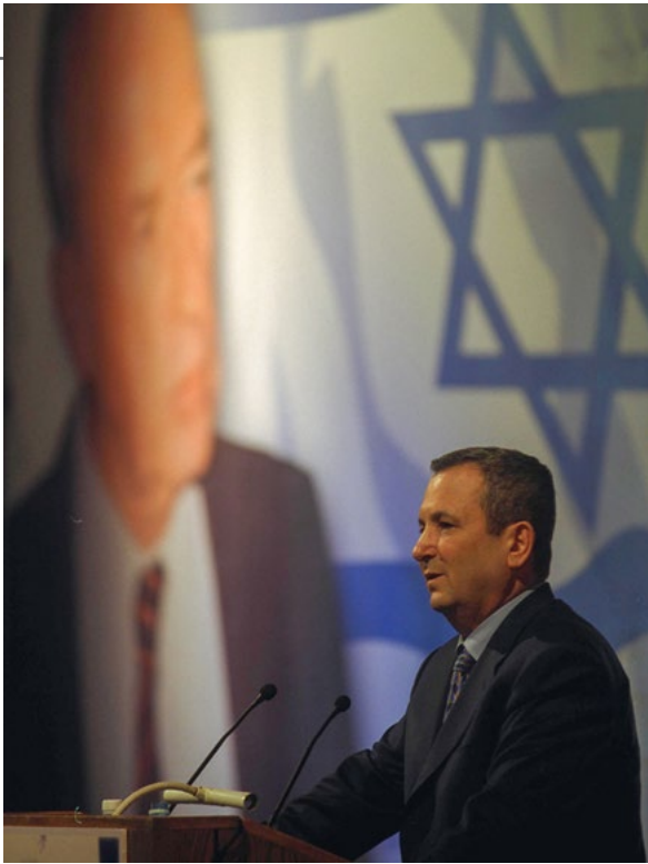
ראש הממשלה לשעבר אהוד ברק, וברקע תמונתו של ראש הממשלה יצחק רבין ד"ר