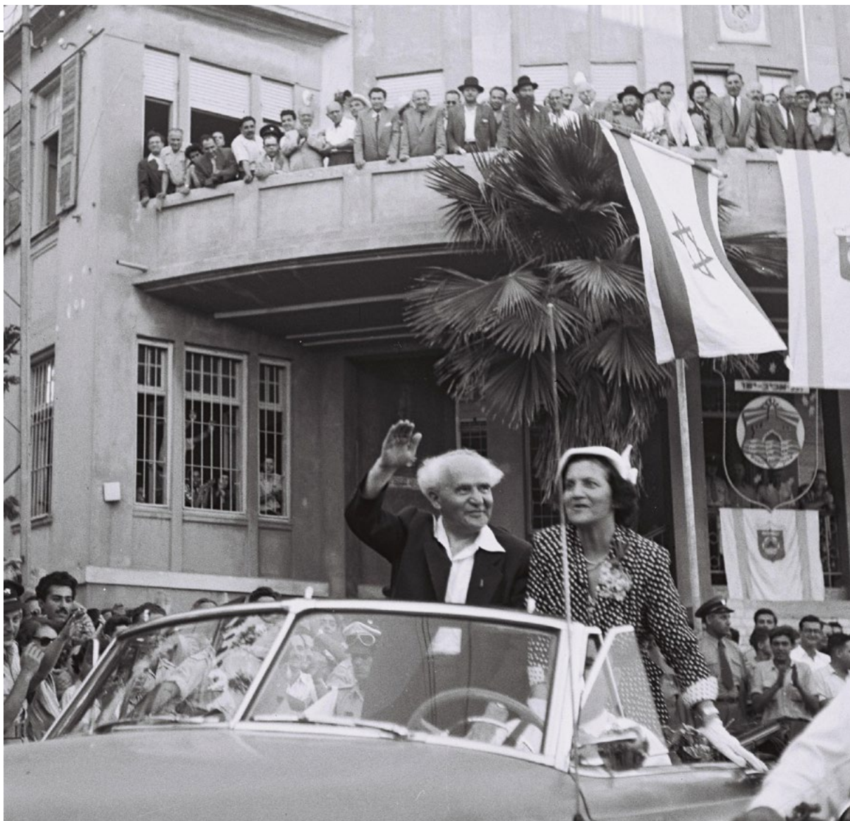
ראש הממשלה המנוח דוד בן גוריון ורעייתו פולה חולפים על פני בניין עיריית תל אביב בדרכם הביתה, עם חזרתם מביקור בארה"ב

התמודדות בבחירות במטרה לדחות את המשפט או להגיע אליו מכיסא ראש הממשלה שעשוי להניב הסדר טיעון מקל, ולא עוד חשש מטריד על אודות מה שבאמת עומד מאחורי כל החלטה של ראש הממשלה.